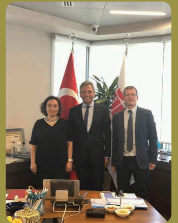
TÜRSAB Başkanı Sn. Firuz Bağlıkaya ile gerçekleştirilen toplantıdan bir kare